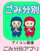
アイコン画像 ごみ分別アプリ