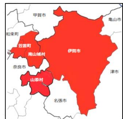
■伊賀・山城南・東大和定住自立圏

なお、本市は、京都府笠置町、南山城村、奈良県山添村と3府県を跨ぐ木津川流域の近隣自治体と「伊賀・山城南・東大和定住自立圏（伊賀城和定住自立圏）」を形成していることから、環境・経済・社会の統合的向上に向けた取り組みを進めていく「地域循環共生圏」の推進として、「流域圏SDGs」の視点を取り入れます。